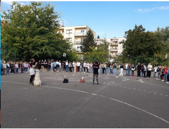
Állatvédelmi Témahét kiállítása: